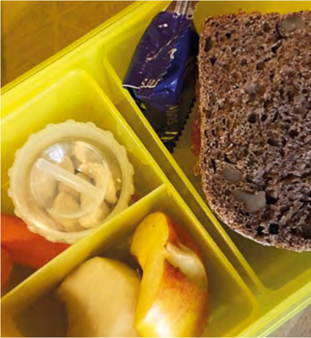
Äpfel oder Birnen? Toast oder Vollkornbrot? Wenn die Kinder mitentscheiden dürfen, wird die Brotdose schneller leer.