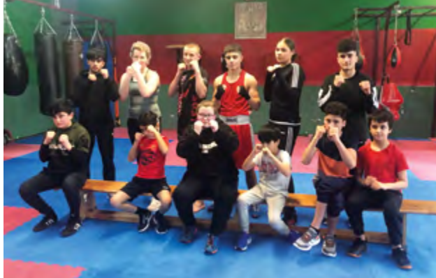
Alle Teilnehmer*innen der Workshops sind mit voller Leidenschaft dabei