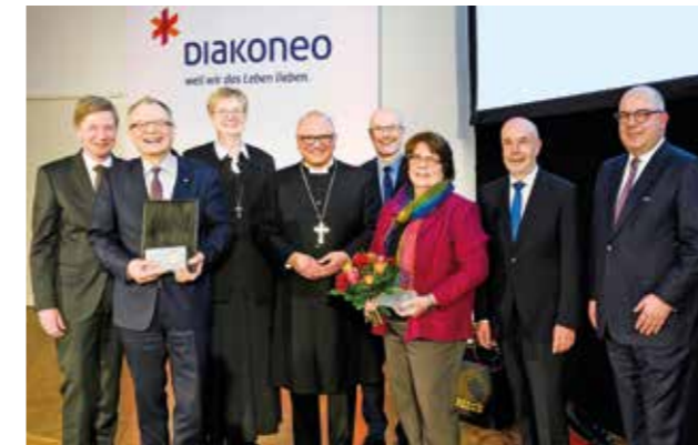
Die diesjährigen Träger der Löhe-Medaille freuten sich mit den Vorstandsmitgliedern von Diakoneo über die Auszeichnung.