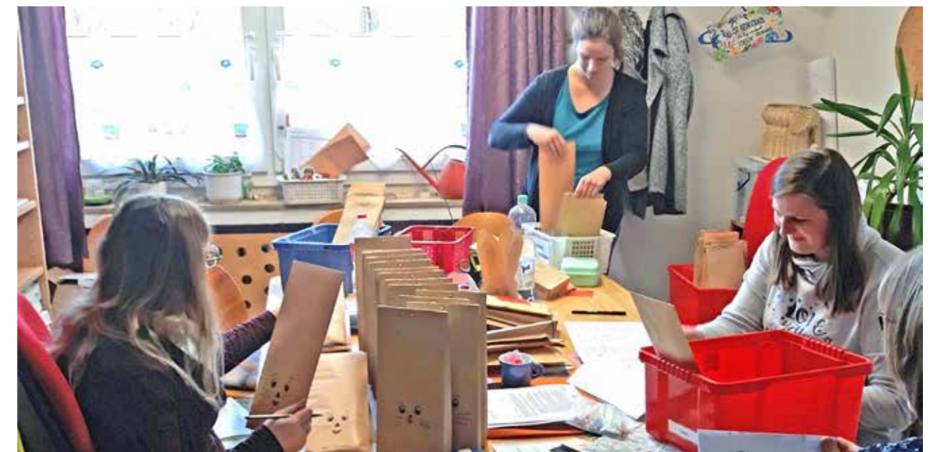
Das Team der Integrativen Kindertagesstätte Laurentius in Neuendettelsau hält mit Briefen und kreativen Ideen Kontakt zu den Familien, deren Kinder im Moment nicht in die Kita dürfen.